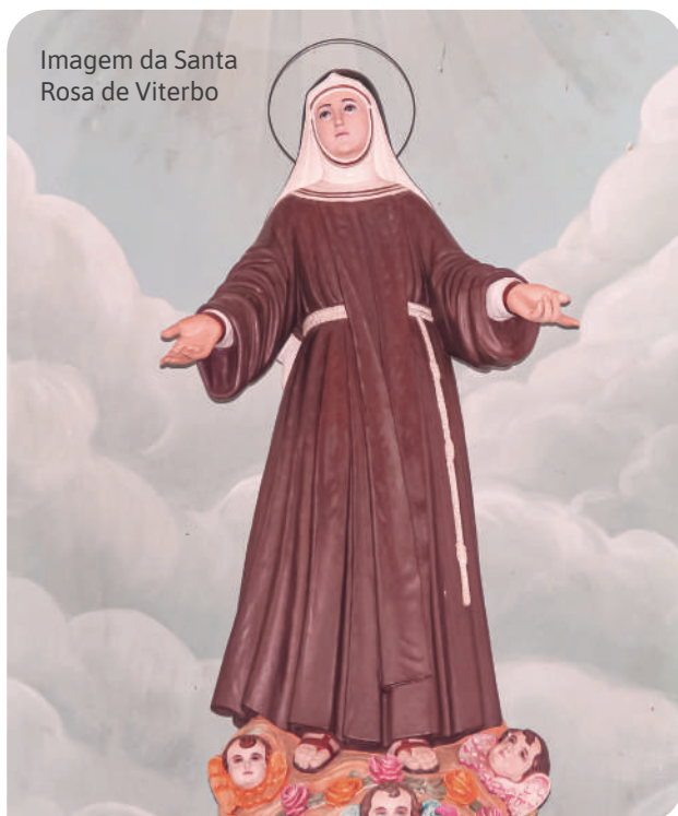
Imagem da Santa Rosa de Viterbo

Em 1983, Santa Rosa de Viterbo assinou um pacto de cidade-irmã, um acordo de cooperação cultural e técnica, com Viterbo, terra natal de Santa Rosa, na Itália. O tratado, em italiano chamado de gemellaggio , ou gemação, tem como objetivo estreitar as relações de amizade, as oportunidades de negócios e políticas públicas, em cooperação mútua entre os municípios.