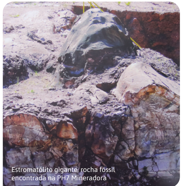
Estromatólito gigante, rocha fóssil encontrada na PH7 Mineradora

Santa Rosa também preserva um sítio paleontológico considerado Patrimônio Mundial da Humanidade, título concedido pela Organização das Nações Unidas para a Educação, a Ciência e a Cultura (Unesco). Nessa área, localizada dentro da PH7 Mineração de Calcário, foram descobertas estruturas formadas há 250 milhões de anos: os estromatólitos gigantes, rochas fósseis compostas por micro-organismos que viveram em ambientes aquáticos. Isso mesmo! Há milhões de anos, em Santa Rosa tudo era mar.