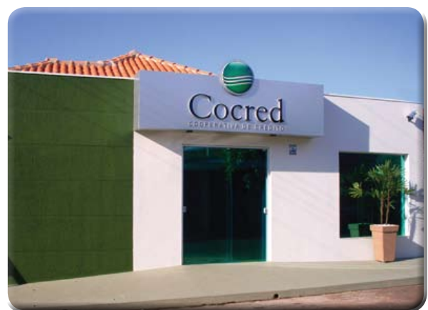
Agência de Cajobi

Em Cajobi, a inauguração aconteceu dia 21 de dezembro. Desde então, os associados não precisam mais se locomover até Severínia para movimentar suas contas. É muito mais facilidade para os cooperados que agora também contam com horário de funcionamento diferenciado, das 8h30 às 15h30.