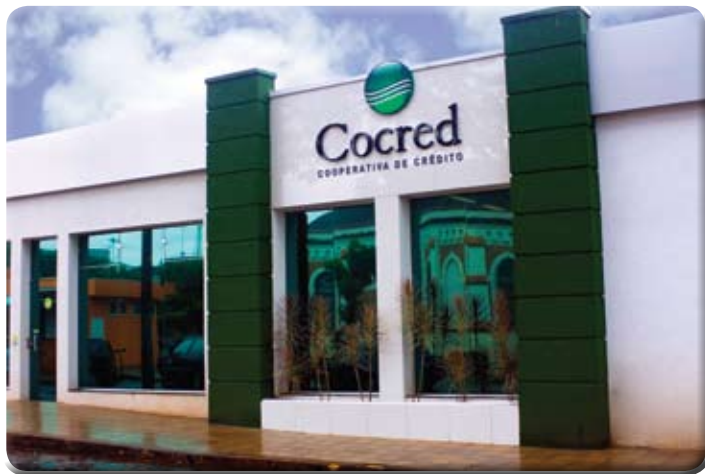
Agência de Jardinópolis

lação do PAC (Posto de Atendimento ao Cooperado), os agricultores e empresários da região podem se beneficiar dos diferenciais que a cooperativa oferece.