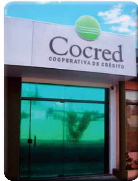
Agência de Bastos

Os associados de Bastos já contam com a agência da Sicoob Cocred em sua cidade desde o dia 28 de outubro. Com a insta-