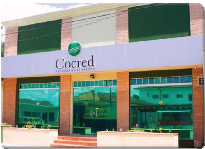
Santa Rosa de Viterbo

Os associados de Bastos já contam com a agência da Sicoob Cocred em sua cidade desde o dia 28 de outubro. Com a insta-